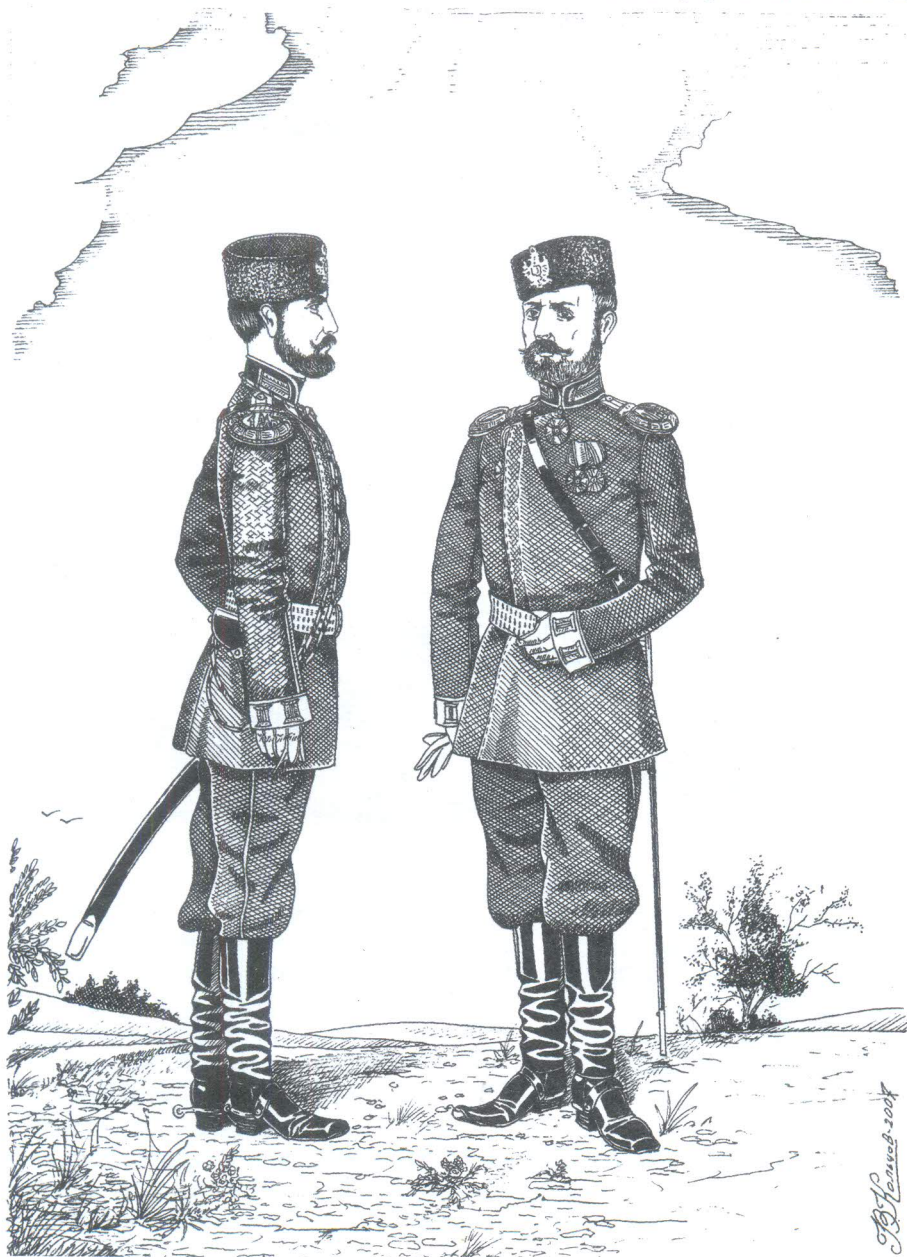
Рис.1. Изображение артиллерийского капитана в форме на 1891 год.

Широкорад А.Б., 2000. Энциклопедия отечественной артиллерии. Минск.