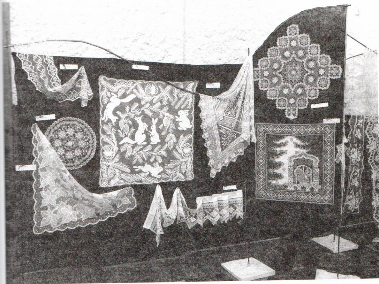
На выставке "Гипор 2006"

этого вида декоративно-прикладного искусства целесообразным является создание музея вышивки.