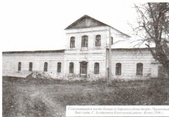
Сохранившаяся часть бывшего барского дома дворян Чариковых Вид сзади. С. Бодяковский Кинешемский район. Фото 2006 г.