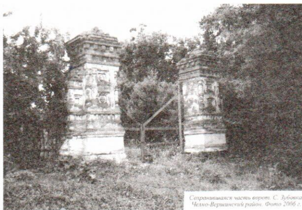
Сохранившаяся часть ворот. С. Зубовка Челно-Вершинский район. Фото 2006 г.

Территория усадьбы представляла собой симметрично распланированный комплекс с жилыми и хозяйственными постройками, оранжереей. Ядро усадьбы образуют главный дом, построенный в стиле классицизма, церковь и флигели. По воспоминаниям старожилов и архивным документам, каменный одноэтажный дом по центру включал в себя мезонин с балконом, поддерживаемым четырьмя колоннами на входе. К дому прилегали хозяйственные постройки. Все строение располагалось на каменном фундаменте, сверху было покрыто железом. Кроме многочисленных хозяйственных строений на территории усадьбы размещались курзалы, кумысные заведения, лавки, каменные номера 8 . Недалеко был цветник с каменными беседками. На склоне, спускающемся к берегу реки, разбит большой фруктовый сад и различные аллеи (рис. 3). Имение служило в основном местом отдыха владельцев.