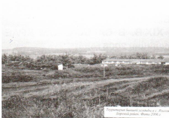
Территория бывшей усадьбы в с. Яльцо Барский район. Фото 2006 г.