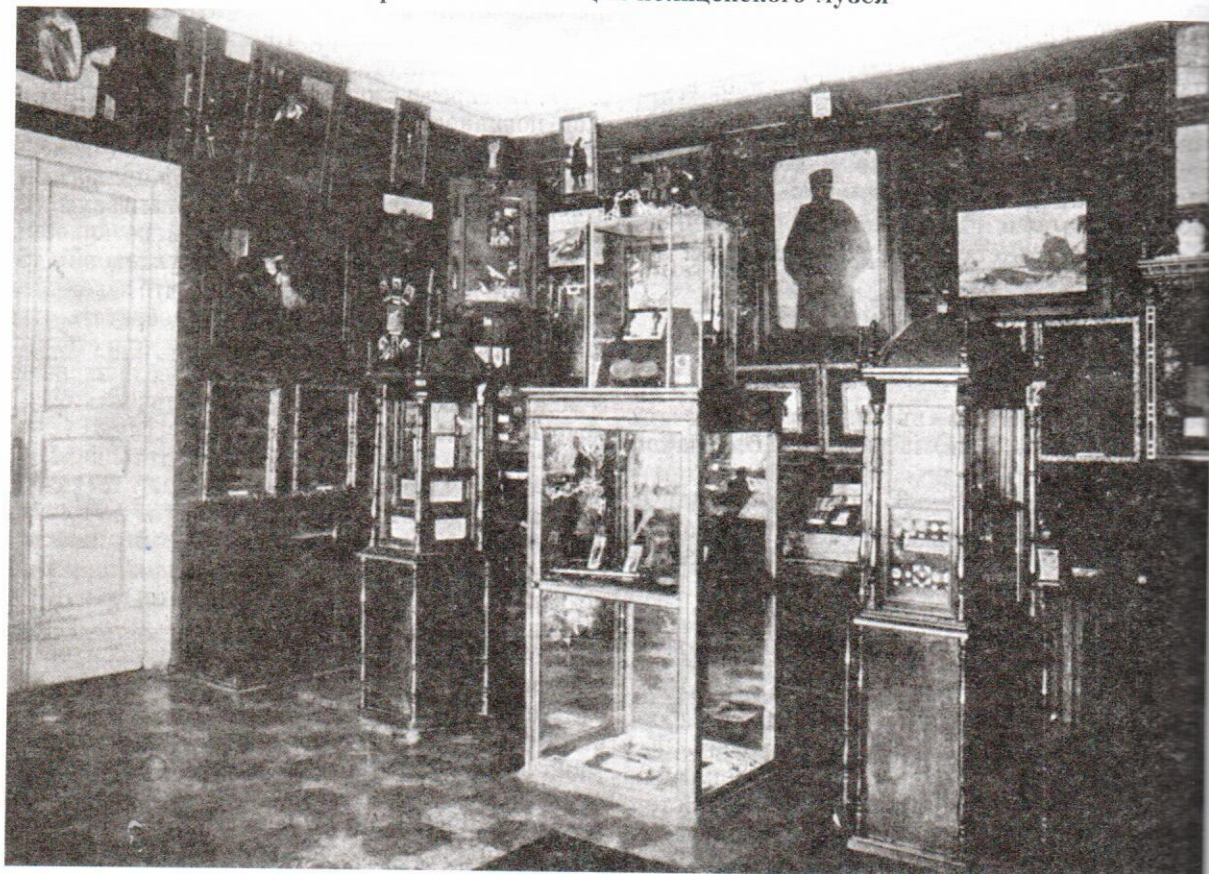
Фрагмент экспозиции полицейского музея

14 мая 1907 г. при Губернском правлении Самарской губернии был открыт Полицейский музей сыска (рис.1). Учитывая высокую социальную и практическую значимость данного учреждения, губернские власти (в лице губернатора В.В. Якунина) оказывали значительное содействие его открытию. Как и многие музеи подобного профиля, он формировался на основе частной коллекции С.П. Белецкого, занимавшего в то время должность Самарского вице-губернатора. Еще в 1900 г. он, будучи известен как "любитель-филантроп дела сыска", начал собирать коллекцию из вещественных доказательств суда по проведенным уголовным делам. Согласно некоторым сведениям, на ее формирование он потратил значитель-