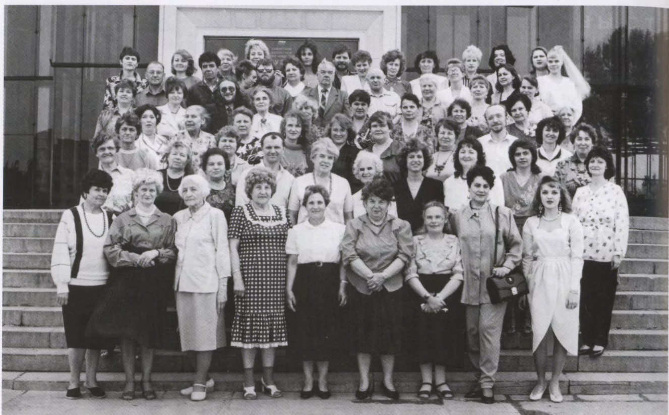
Сотрудники Самарского областного историко-краеведческого музея им. П.В. Алабина. 1995 г.