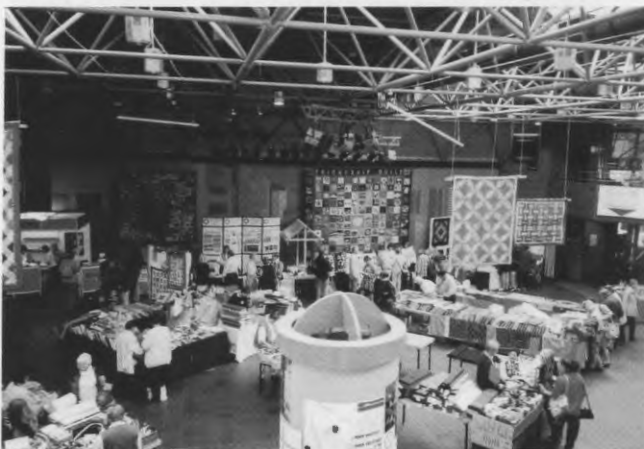
Квилт-фестиваль в музее. 1996 г.