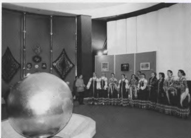
Открытие первой выставки в круглом зале музея. 19.11.1993 г.

На работу с детской аудиторией рассчитана и организованная впоследствии в основном