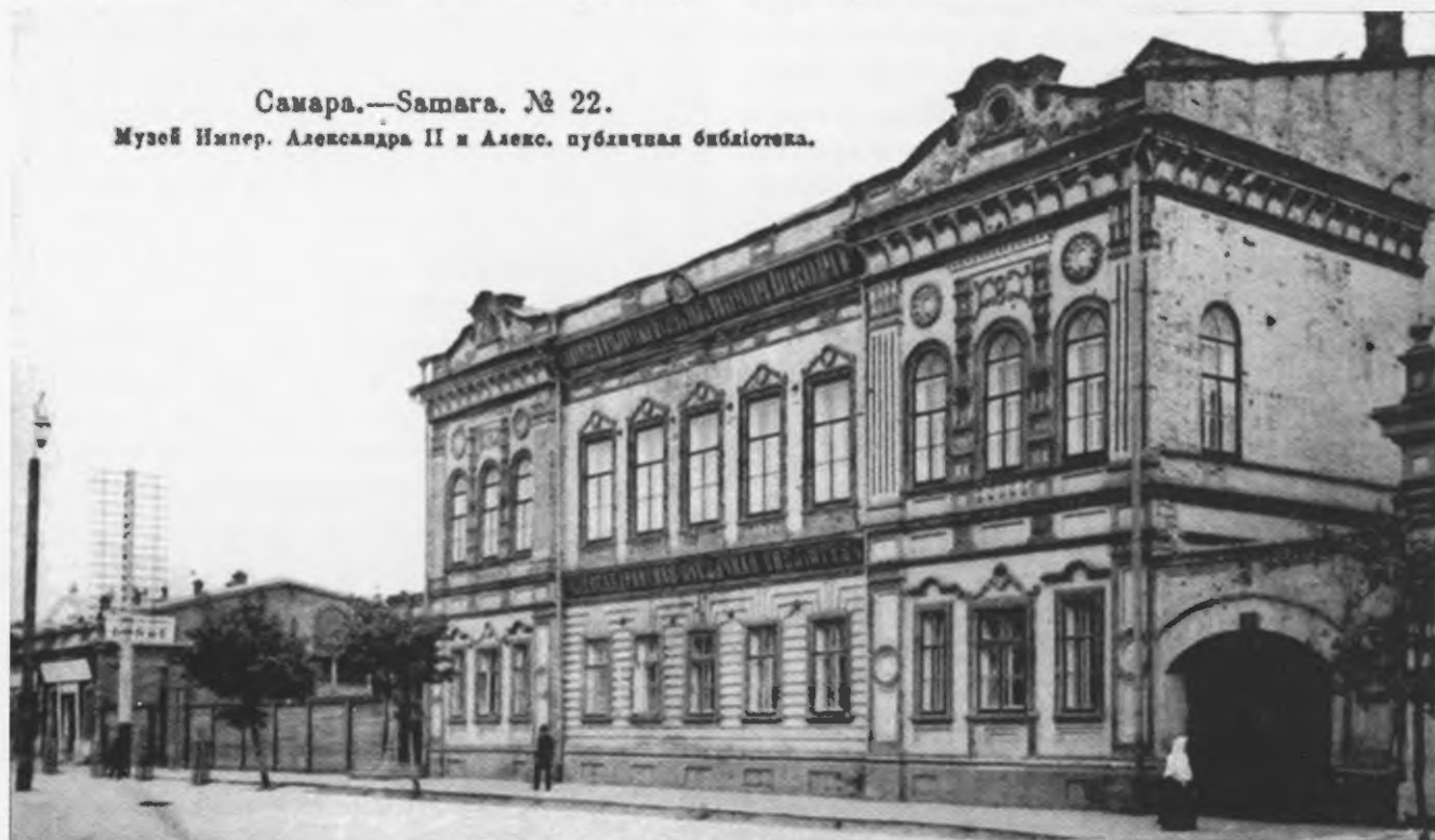
Здание музея на ул. Дворянской, 145. 1880-е гг.