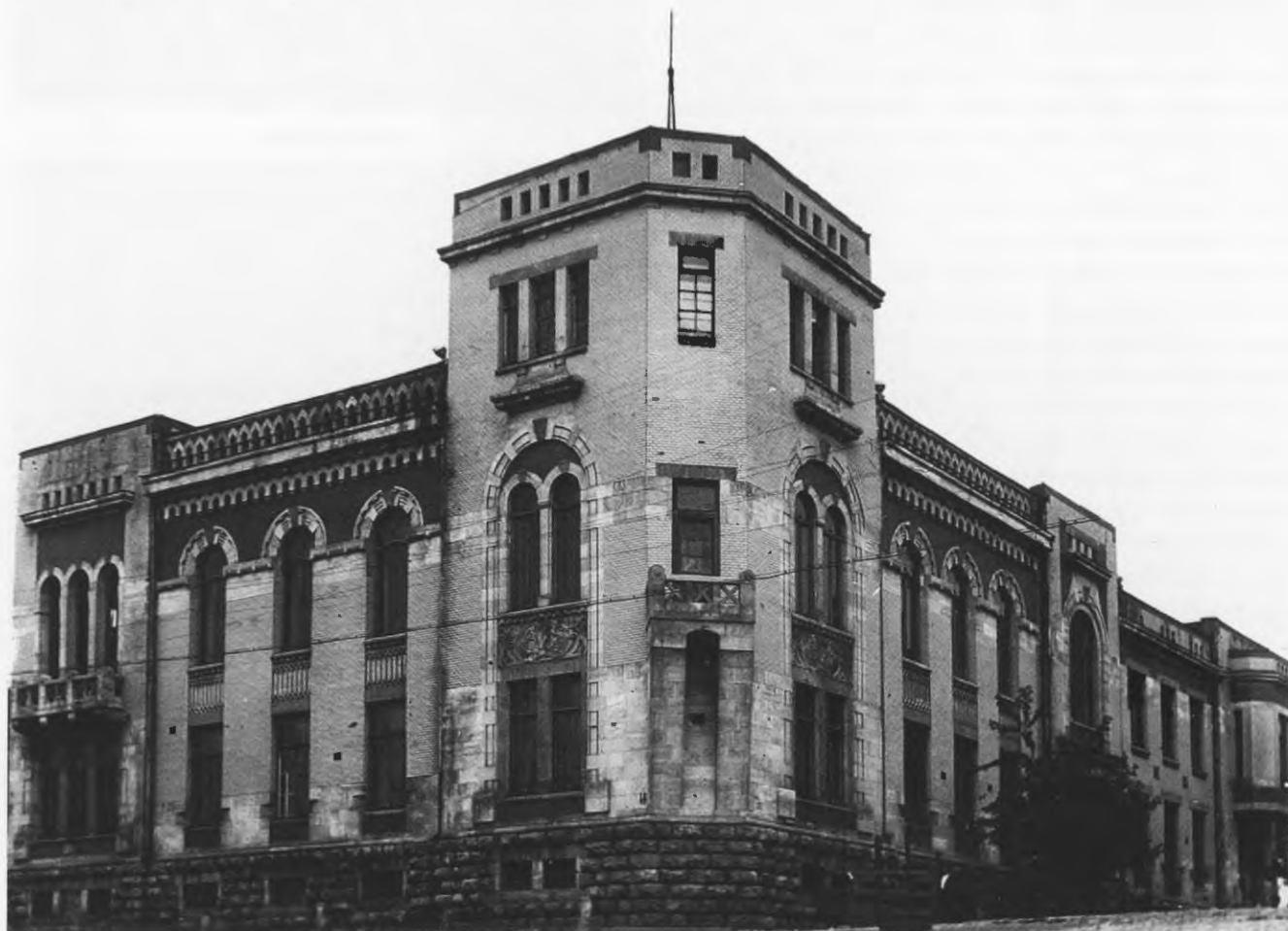
Здание музея в 1933-1941 гг. Ул. Пионерская, 22