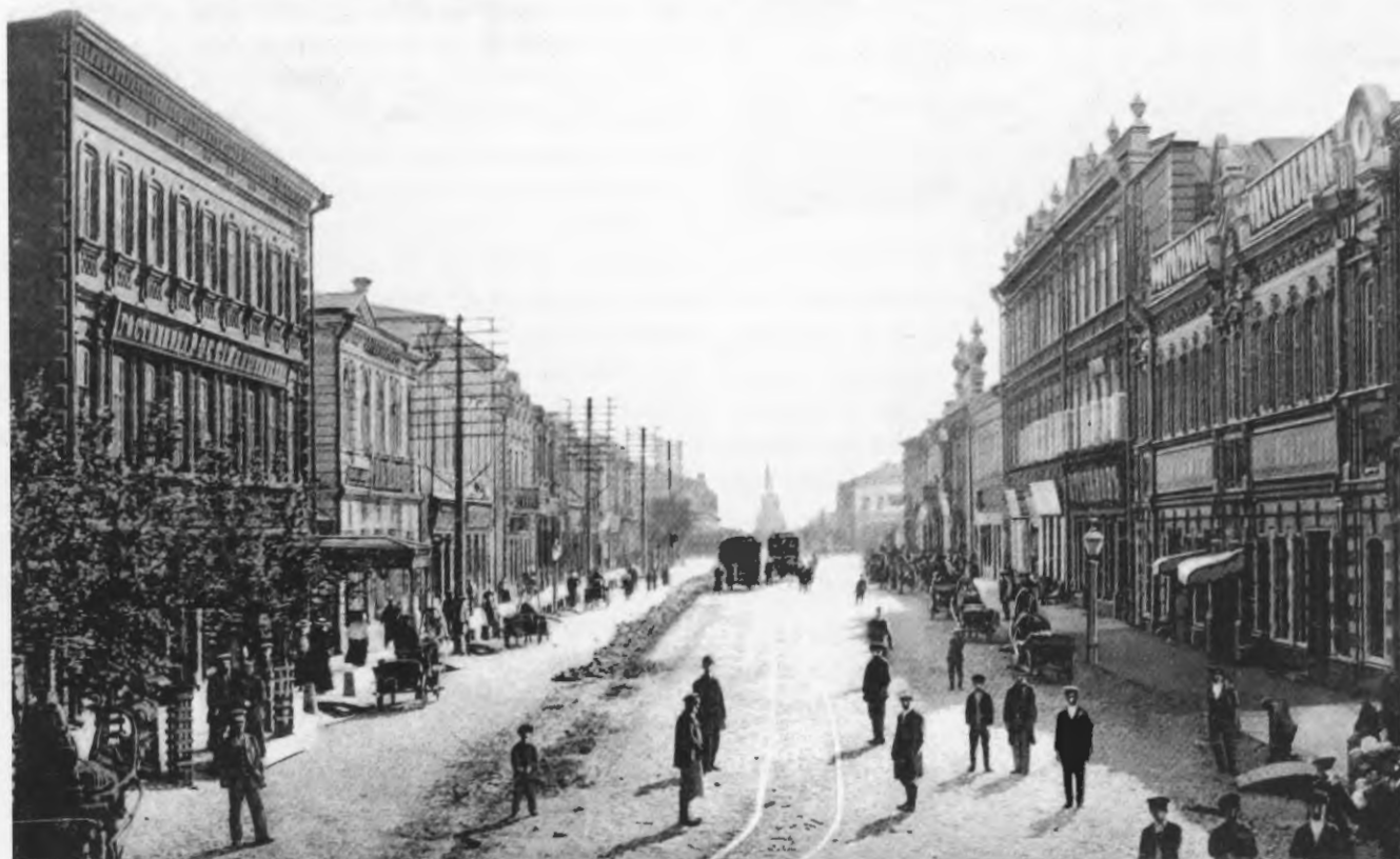
Первое здание музея в доме Христензена (на фото – первый дом слева). 1880-е гг.