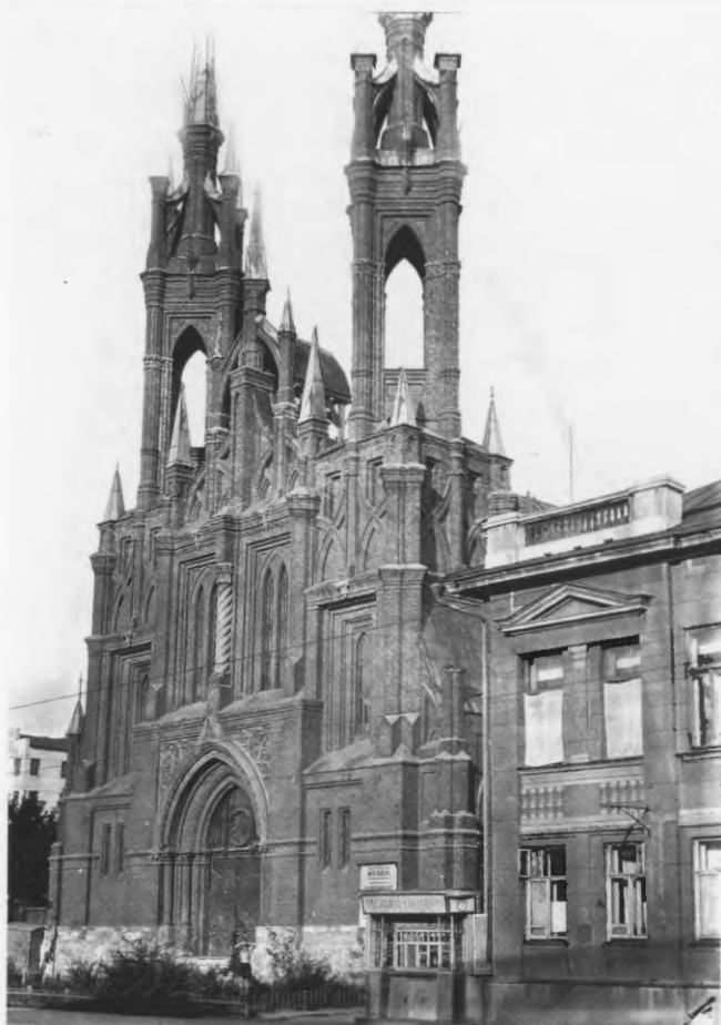
Здание католического костела, в котором располагался музей в 1941-1993 гг.