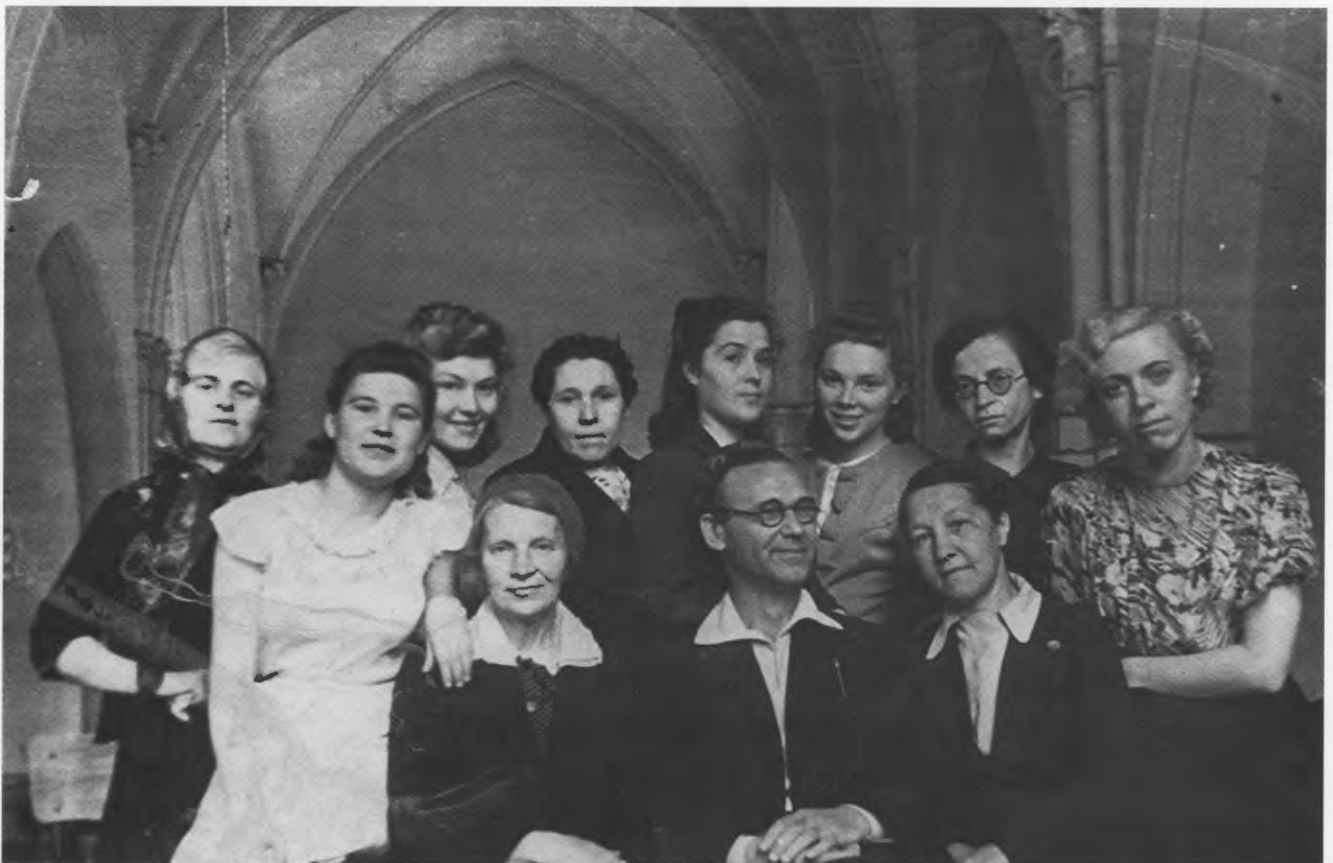
Сотрудники Куйбышевского областного музея краеведения. 1943 г.