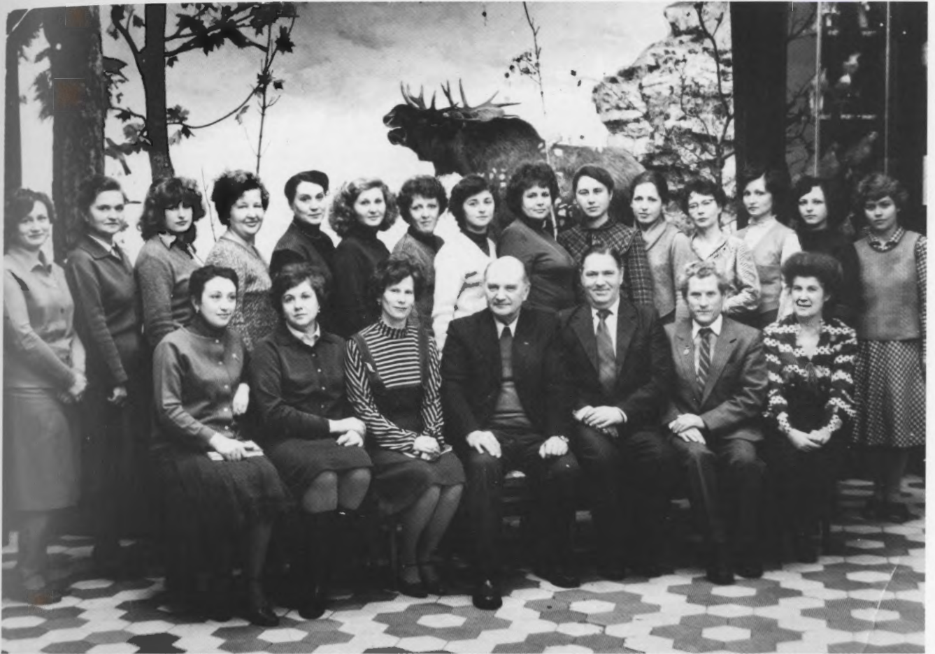
Сотрудники Куйбышевского областного музея краеведения. 1984 г.