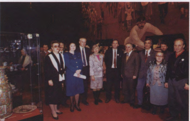
Открытие выставок Самарского областного историко-краеведческого музея им. П.В. Алабина в здании бывшего Ленинского мемориала. 19.11.1993 г.

там принимали присягу молодые воины. В 1977 г. был поставлен своеобразный музейный рекорд, превзойти который в Самаре вряд ли когда-нибудь удастся: за год музей посетило около 500 тысяч человек.