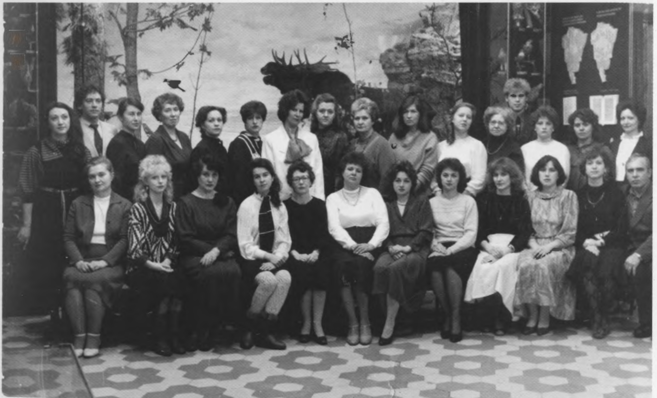
Сотрудники Куйбышевского областного музея краеведения. 1988 г.