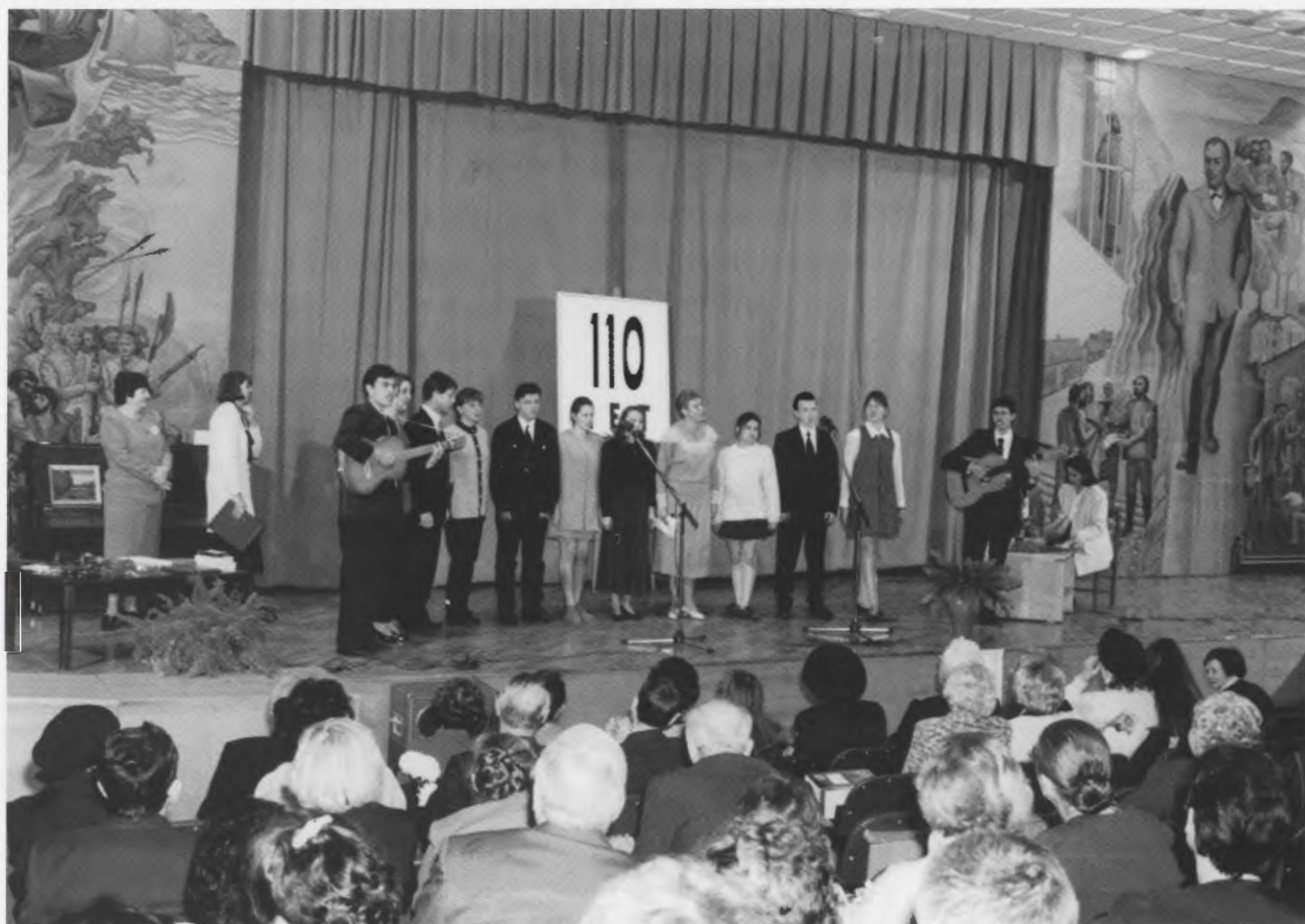
Фрагмент торжественного вечера, посвященного 110-летию Самарского областного историко-краеведческого музея им. П.В. Алабина. 1996 г.

В 1990-е гг. музей фактически становится одним из центров научной и краеведческой работы Поволжского региона. В 1993 г. в музее была проведена региональная научно-практическая конференция «Проблемы регионального природоведения», в 1994 г. - научная конференция, посвященная 170-летию