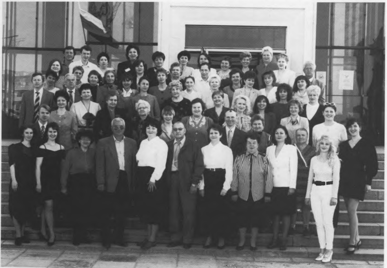
Сотрудники Самарского областного историко-краеведческого музея им. П.В. Алабина. 1997 г.