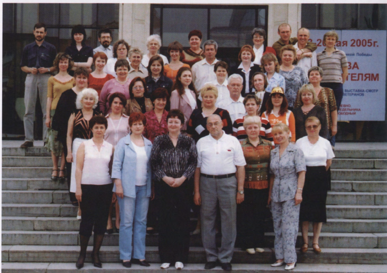
Сотрудники Самарского областного историко-краеведческого музея им. П.В. Алабина. 2005 г.