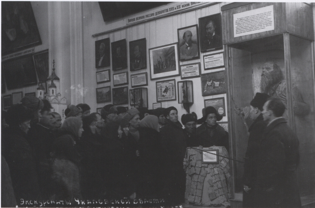
Экспозиция антирелигиозного музея. 1940 г.