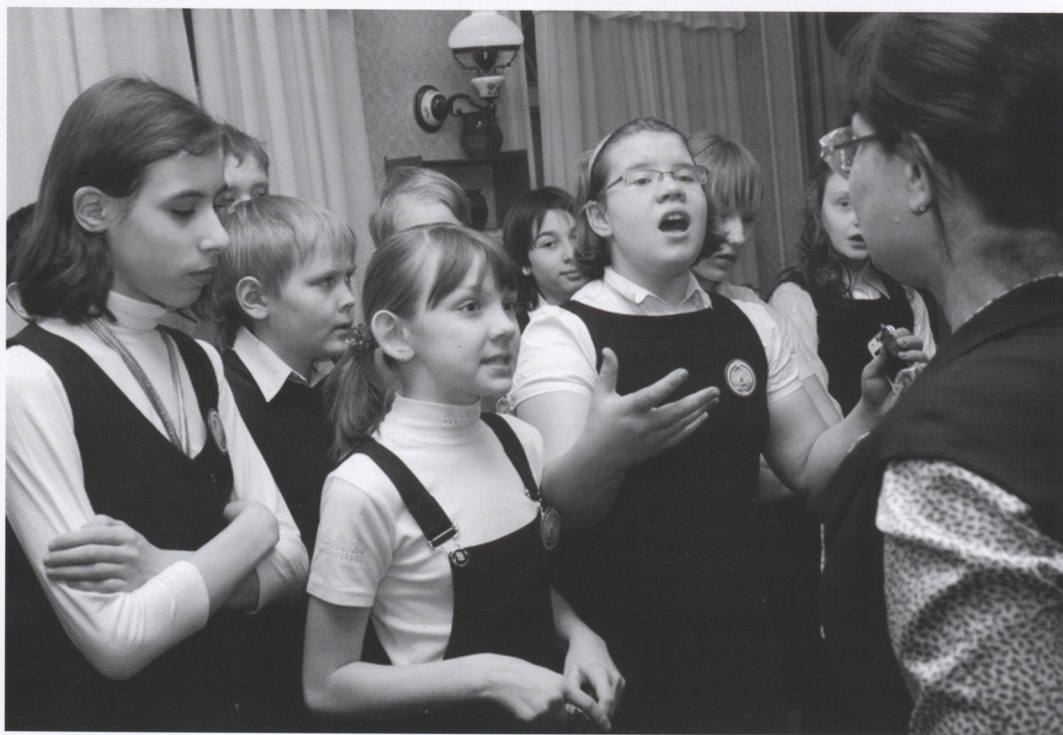
На выставке «На всякое семья-свое время...». 2006 г.

И составление загадки, и ее разгадывание требуют пристального наблюдения над предметами, явлениями, действиями, а, значит, развивают наблюдательность, мышление, позволяют составить достаточно точное представление о том или ином экспонате. Отсюда и название выставки - «На всякое семья-свое время»: у каждого старинного предмета - свое предназначение, и живет он в определенной среде, в определенную эпоху. А малые формы