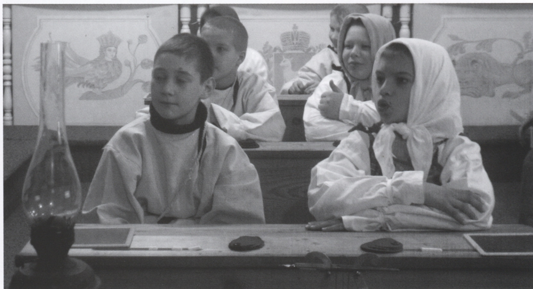
На выставке «Мы все учились». 2010 г.

Таким образом, экспозиции и программы последних лет, построенные на креативной основе, с применением принципа интерактивности, носят полифункциональный характер, открывая перед посетителями свободное