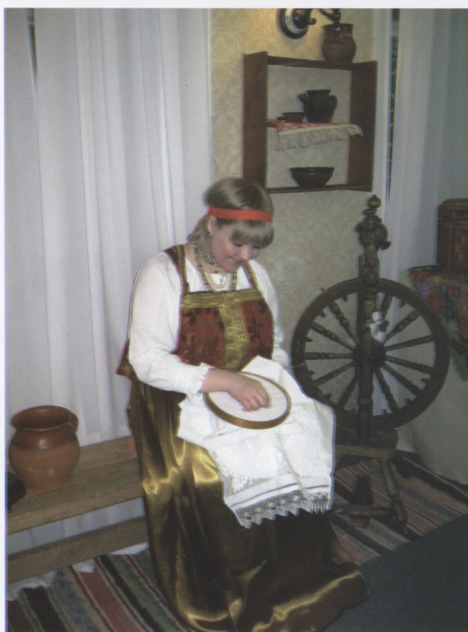
На выставке «На всякое семя-свое время..». 2006 г.