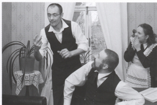
Фрагмент спектакля в музейных интерьерах «И снова здесь, 120 лет спустя». 2009 г.