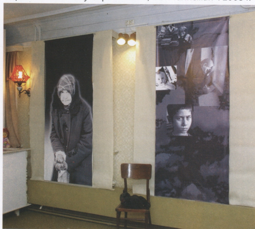
Фрагмент выставки «Храни меня, мой талисман» - «Несчастное детство, одинокая старость». 2008 г.