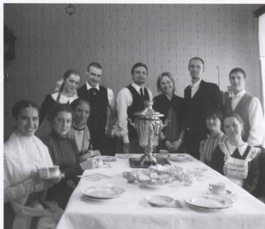
Участники спектакля в музейных интерьерах «И снова здесь, 120 лет спустя». 2009 г.