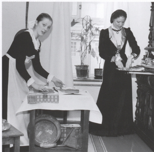
Фрагмент спектакля в музейных интерьерах «И снова здесь, 120 лет спустя». 2009 г.