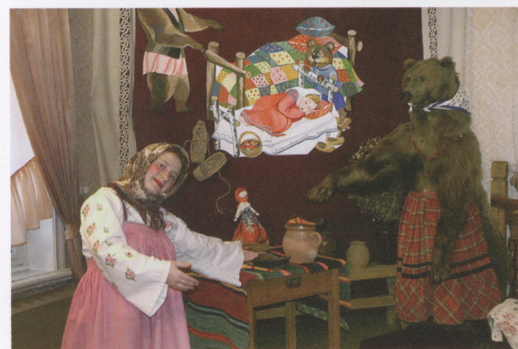
На выставке «Жили-были». 2008 г.

обстановку и атмосферу жизни семьи Ульяновых, чрезвычайно актуальным для творческого коллектива музея стало объявление 2008 года в России Годом Семьи.