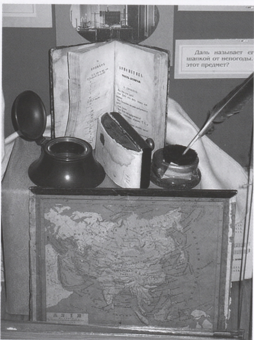
Фрагменты выставки «Знакомые незнакомцы». 2006 г.

В 1990-е годы была организована целая серия тематических выставок, связанных с профильной тематикой и мемориальными характеристиками здания, в котором расположен музей. По сути каждая из них глубже раскрывала ту или иную тему, проблему, которая лишь вскользь обозначалась стационарной экспозицией. Поскольку две трети музейной аудитории составляют дети и молодежь, именно им была адресована тематика выставочных экспозиций. Среди них: «Кукла народов мира», 1995 г.; «Школа и школьники в прошлом веке» (из фонда музея истории с. Усолье. 1996); «Волшебный клубочек» (по русским народным и классическим авторским сказкам), 1997 г.; «Быт и досуг городских детей конца XIX - нач. XX вв.», 1998 г.; «Русская кухня и столовый этикет прошлого века», 1999 г.; «Спешили делать добро...» (о родственниках семьи Ульяновых), 1999 г.; «Штрихи к портрету», 1999 г.; «Лик вождя или лицо человека?», 1999 г.; «Самара неофициальная (из частной коллекции), 2001 г.; «Самара в зеркале прогресса», 2001 г. и другие.