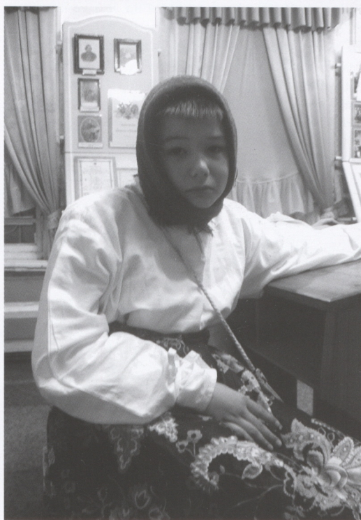
На выставке «Мы все учились». 2010 г.