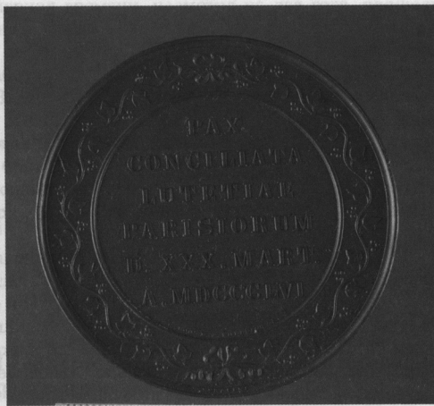
Медаль «В память Парижского мира». 1856 г. Обратная и лицевая стороны. СОИКМ. КП-3475.