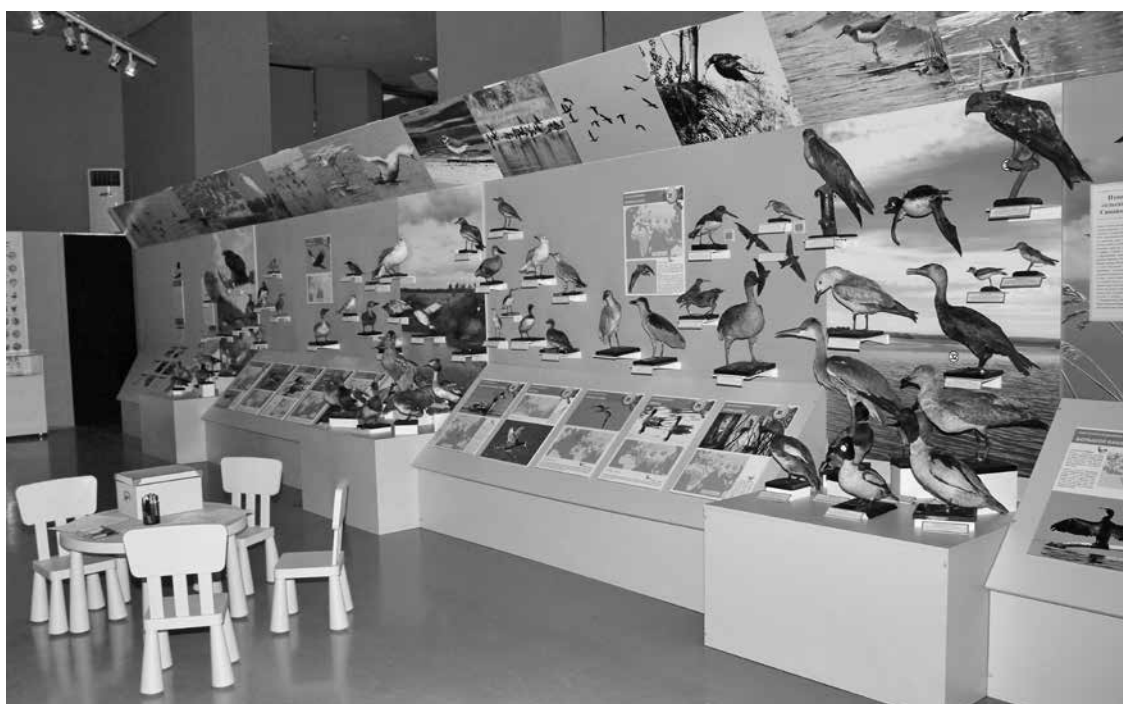
Рис. 13. Фрагмент выставки «Пора домой. Удивительный мир перелетных птиц». Фото Д.В. Варенова, 2016 г.

для познания птиц области и ее динамики. Коллекция нуждается в постоянной таксидермической обработке в целях сохранения. Необходимо ее пополнение недостающими видами для обеспечения полноты представленности разнообразия птиц области (в настоящее время в коллекции представлено 2/3 видового состава птиц области), а также пополнение новыми экземплярами уже имеющихся видов в связи с утратой выставочных образцов в процессе эксплуатации. Для подтверждения достоверности определения предметов орнитологической коллекции необходимо привлечение специалистов.