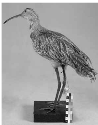
Рис. 4. Большой кроншнеп (описи музея 1921-1922 гг.).

чучелах указана информация о месте добычи птиц на территории области: гагара – в районе с. Старая Майна; кулик голоступень – с. Тушино на Волге; мухоловка серая – за р. Самаркой; подорлик – с. Страмиловка; стрепет (3 экз.) – в р-не с. Страмиловка; пеночка лесная – в окрестностях с. Смышляевка; чиж – за р. Самаркой. В этом же году получена коллекция яиц, собранная в Симбирской губернии и череп цапли. За период с 1901 по 1909 гг. музеем было приобретено 116 чучел птиц, из них 50 видов - обитатели Самарской губернии (Отчеты..., 1905; 1911).