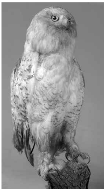
Рис. 5. Полярная сова (описи музея 1921-22 гг.).