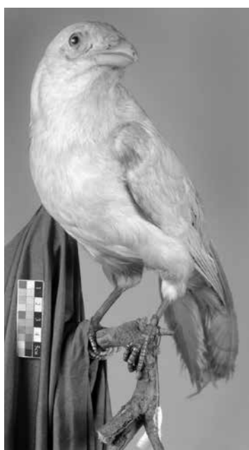
Рис. 3. Сорока-альбинос (описи музея 1921-1922 гг.).