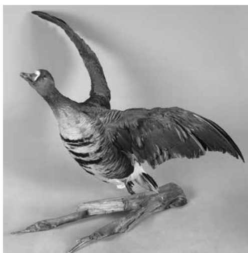
Рис. 11. Белолобый гусь. Таксидермист А.С. Краснослободский, 2007 г. Фото Б.А. Агузарова.