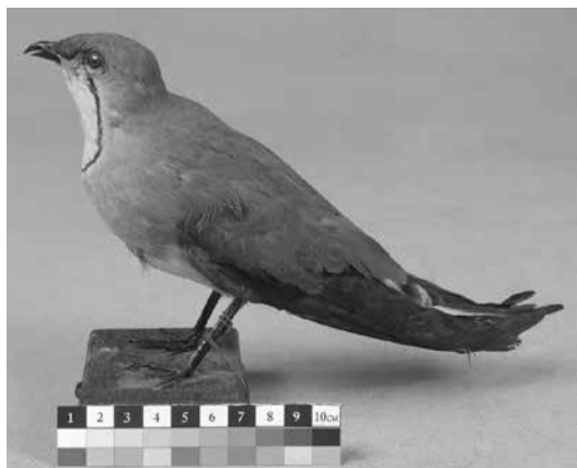
Рис. 2. Степная тиркушка (описи музея 1921-1922 гг.).