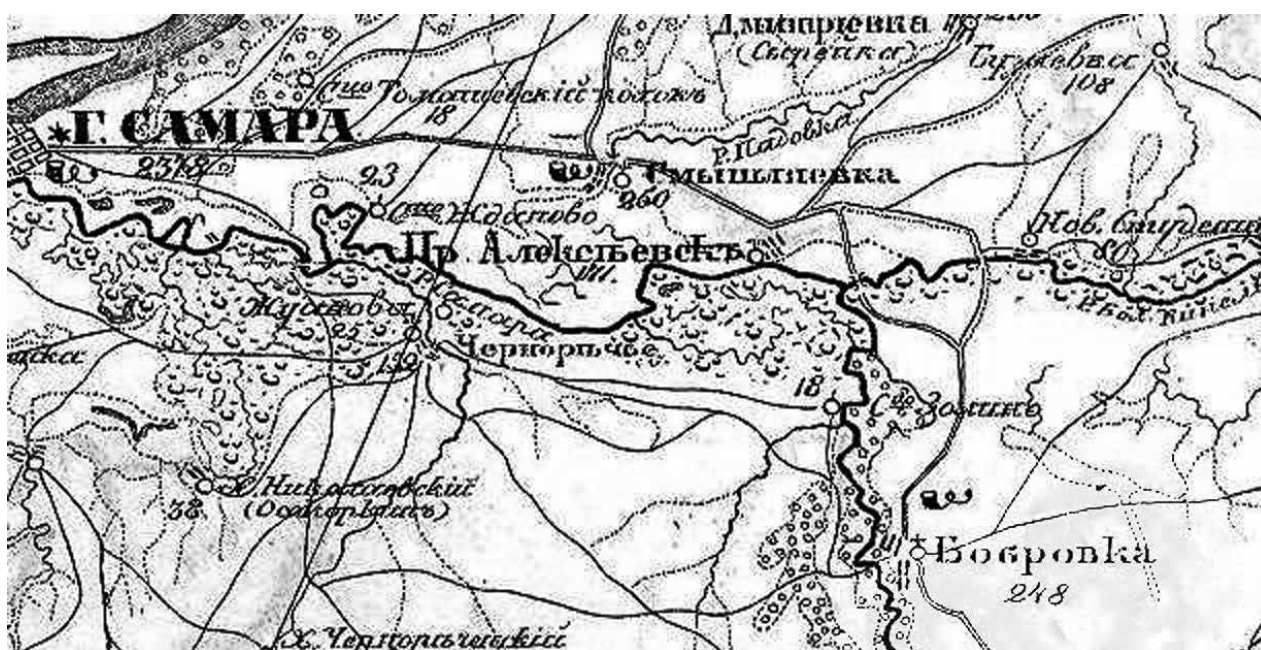
Рис. 1. Фрагмент карты 3-х верстки Самарской губернии, 1861 г. Генерального штаба Российской армии под ред. генерал-лейтенанта А.И. Менде.

На рис. 1 представлен фрагмент карты 3-х верстки Самарской губернии 1861 года Генерального штаба Российской армии под редакцией генерал-лейтенанта Александра Ивановича Менде. Из пояснительных докладных записок военного картографа К. Теннера к этой карте с описанием каждого квадрата