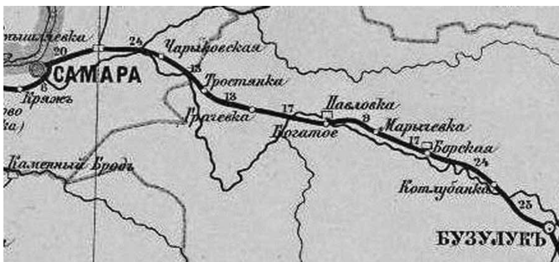
Рис. 3. Фрагмент почтовой карты Российской Империи. 1881 г.

Версты считались от станции Батраки и на 160 версте на земле, принадлежавшей Валерию Ивановичу Чарыкову (на то время Вятскому губернатору), начинается строительство узловой станции.