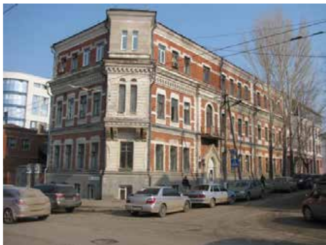
Современное здание Самарской больницы филиала № 1 ФГБУЗ СМКЦ ФМБА России.