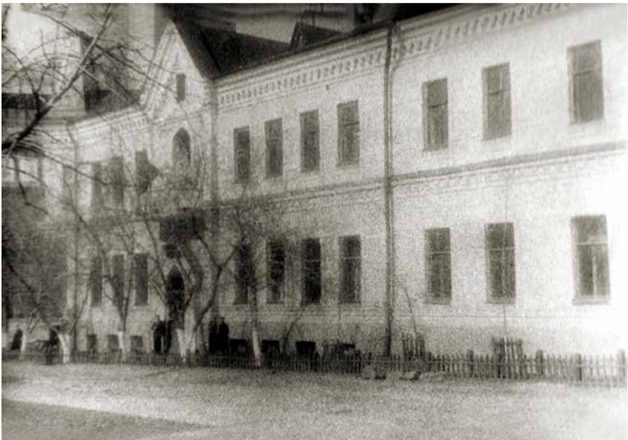
Рис.1. Здание Куйбышевской поликлиники Средне-Волжского водздравотдела по улице Степана Разина в 1940-е гг. Фотоальбом «Средневолжский водздравотдел». 1949.

22 июля 1941 г. в г. Куйбышев убыла оперативная группа ЛСУК в количестве 25 человек с медицинским оборудованием для организации медицинского обслуживания уже прибывшей в этот волжский