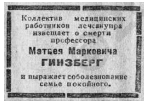
Некролог проф. Гинзбергу М.М. в газете «Волжская коммуна». 2 апреля 1942 г. № 78. С.4.