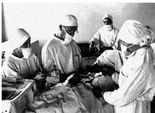
Рис.6. На операции в Куйбышевском военном госпитале.

В связи с необходимостью дополнительно развернуто 5 инфекционных коек при центральной больнице им. Пирогова.