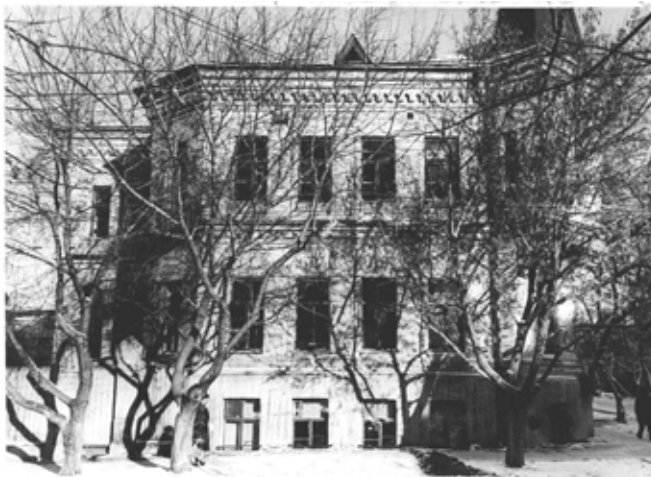
Рис. 2. Здание Куйбышевской поликлиники Средне-Волжского водздравотдела в 1950-е гг. (по улице Пионерской). ЦГАСО. Ф. Р-4347. Оп.1. Д.29. Л.93а.

город части прикрепленного контингента и выполнения следующих задач: