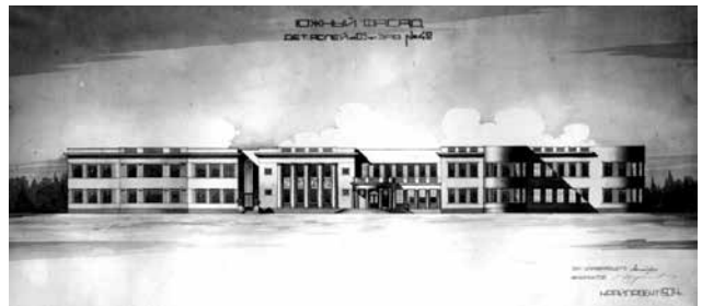
Рис. 8. Проект детских заводов № 42