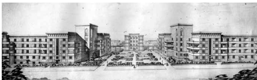
Рис. 16. Проект комплекса жилых домов для работников Карбюраторного завода