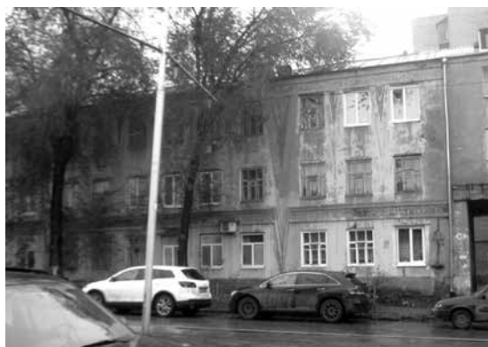
Рис. 6. Здание Дома просвещенцев в настоящее время