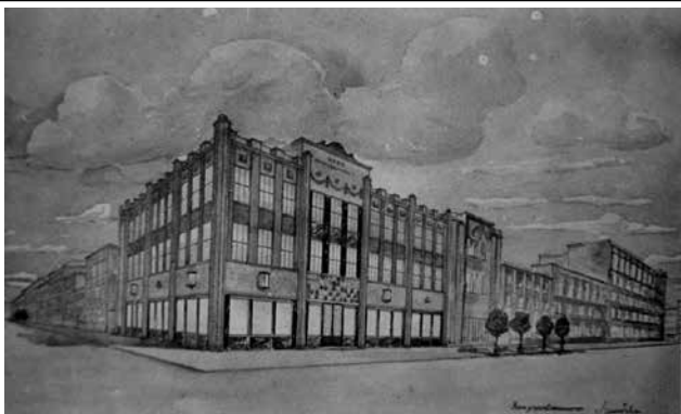
Рис. 3 Проект швейной фабрики Крайшвейтреста