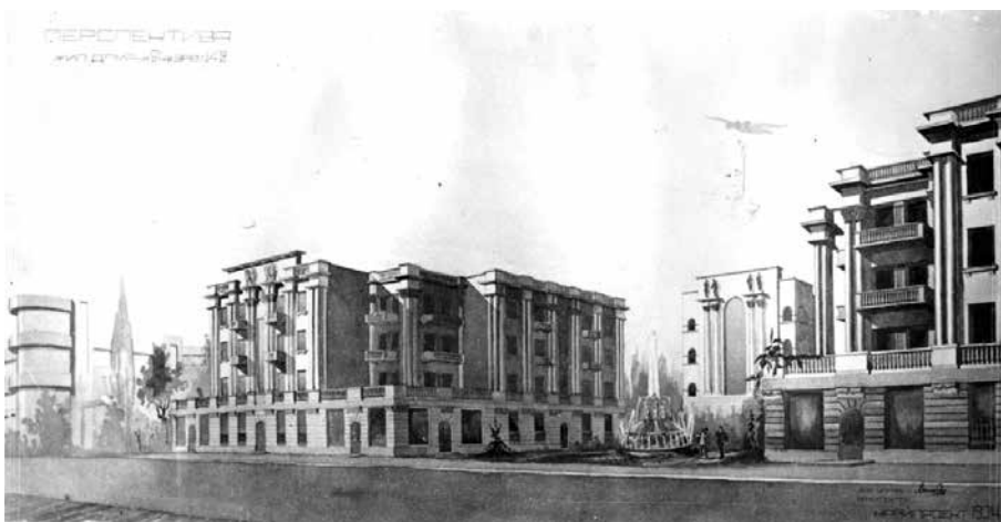
Рис. 14. Проект комплекса жилых домов для работников завода № 42 (перспектива)