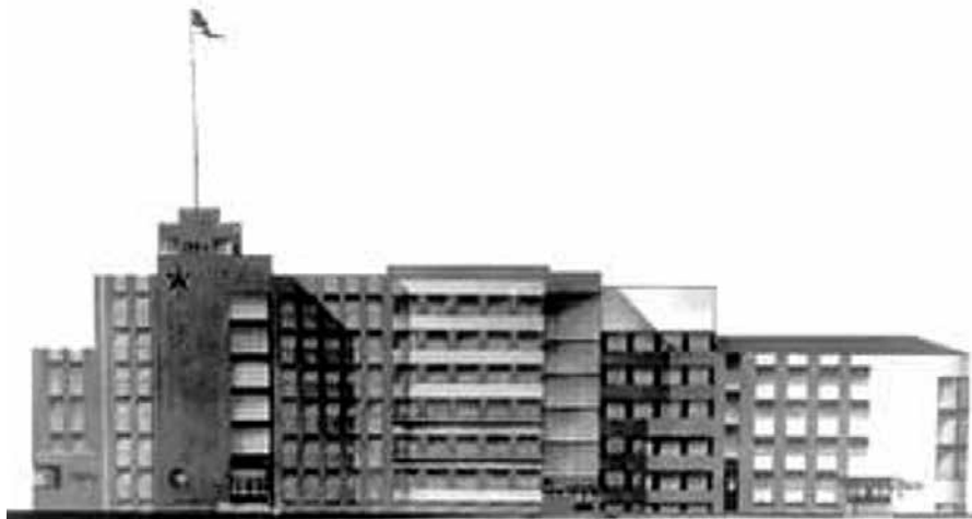
Рис.1. Проект здания ПриВО