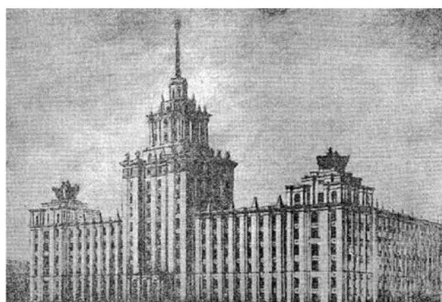
Рис. 12. Проект здания филиала Гидропроекта и «Куйбышевэнерго»

проект П.А. Щербачеву, хотя ясно видна надпись: «Проектировано: Георгиева». По проектам этой группы построено много и других, довольно известных в Самаре зданий. Однако многие проекты остались неосуществленными.