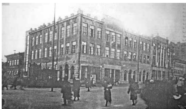
Рис. 4 Здание швейной фабрики Крайшвейтреста

Ему поручают грандиозный проект – строительство целого ансамбля Штаба ПРИВО и окружного Дома офицеров. И он справляется с этой задачей. В 1930 г. выстроен штаб ПриВО, в 1932 г. закончена постройка ДКА (впоследствии – окружного Дома офицеров).