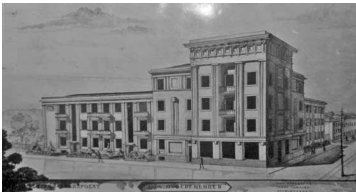
Рис. 5. Проект Дома просвещенцев (перспектива)

Во-первых, не все осуществленные проекты оказались реализованными полностью. Уже второй проект Щербачева – Штаб ПРИВО – подвергся некоторому изменению в сторону упрощения, что явно ухудшило задумку автора (рис. 1; 2).