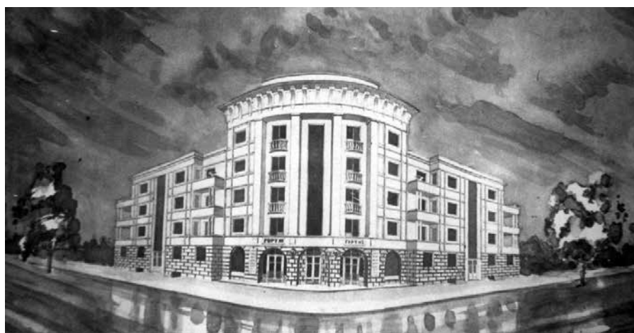
Рис. 15. Проект Дома для инженерно-технических работников Карбюраторного завода