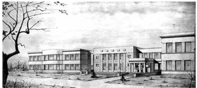
Рис. 9. Проект яслей карбюраторного завода