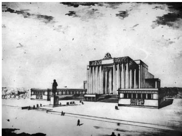
Рис. 11. Проект Дворца культуры на площади Куйбышева