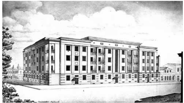
Рис. 7. Проект Дома Крайшвейтреста (Перспектива)