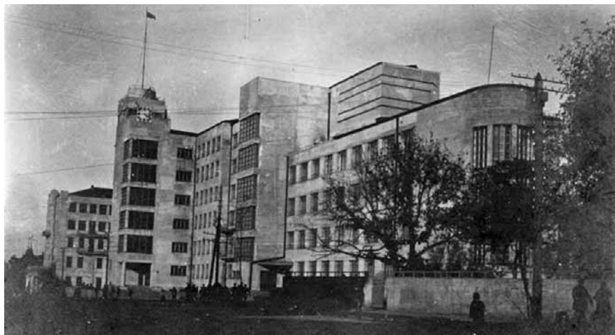
Рис. 2. Здание ПриВО