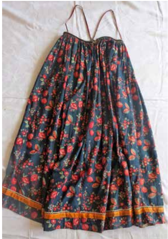
Фото 4. Сарафан прямой (круклый), с. Арзамасцевка Богатовского района Самарской области.