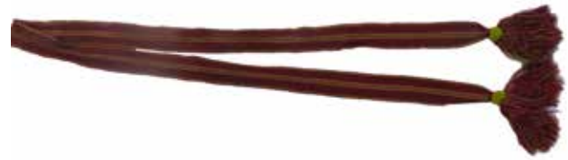
Фото 8. Пояс плоский, с. Тростянка Богатовского района Самарской области.

В селах Усманка и Таволжанка Борского района нами зафиксирована «парочка» - комплекс кофты и юбки, сшитых из одной материи, из синтетической ткани сиреневого цвета, принадлежавших участнице фольклорного коллектива Усманского сельского дома культуры имени В. Терешковой, сшитая в 1970-х гг. по образцу начала XX в. Длинная прямая юбка вверху собрана на резинку, по подолу нашиты узкие атласные ленты голубого и желтого цвета. Кофта раскошена к низу, воротник-стойка, застегивается слева в плечевом шве на кнопки. Перед и спинка украшены белыми кружевами и буфами – особыми округлыми складками из полосы ткани, сложенной в несколько слоев и стянутой поперечными швами в цепочку. На груди настроены вертикальные защипы и нашиты три полосы голубой атласной ленты.