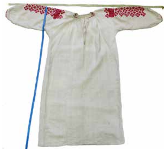
Фото 1. Рубаха женская домотканая. Конец XIX в., с. Богатое Богатовского р-на Самарской обл.