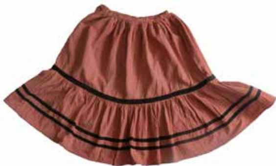
Фото 2. Юбка-подставОк, с.Аверьяновка Богатовского района Самарской области.