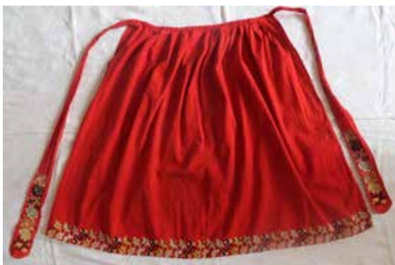
Фото 6. Фартук, с. Аверьяновка Богатовского района Самарской области.