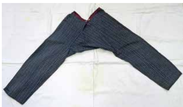
Фото 16. Порты, с ластовицей из двух клиньев, с пришивным поясом, с. Кураповка Богатовского района Самарской области.

холста и выполняли роль нижнего белья. Порты были распространены повсеместно. Мужские рубахи, как и женские, имели изменения в крое с развитием мануфактурного производства. Изначально они шились из прямого домотканого полотна, перегнутого по утку, без плечевых швов. С боков вшивались прямые или косые клинья-«бочки», которые увеличивали ширину рубахи, прямые или скошенные к низу рукава и обязательно ластовицы. Разрез на груди располагали по центру или смещали в бок, чаще на левую сторону, горловину обрабатывали обшивкой; такие рубахи получили название «голошейка». Впоследствии наибольшее распространение получили рубахи-«косоворотки» с воротником «стойка» и планкой-застежкой. В основном планку делали слева, хотя иногда встречались рубахи с планкой на правую сторону. Рукава делали длинные, собранные в складки по плечу, низ собирался в складки под манжету или зауживался и оставался свободным.