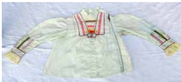
Фото 14. Кофта распашная сатиновая с воротником-стойкой, из коллекции Е.В. Ямщиковой, с. Тростянка Богатовского района Самарской области.