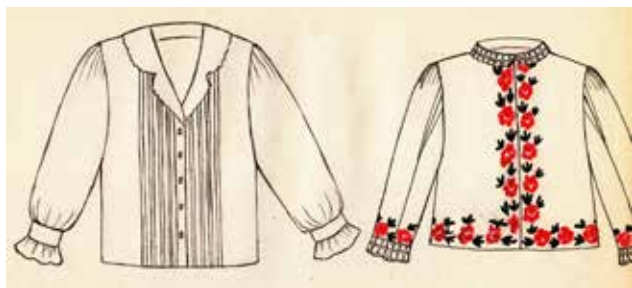
Фото 11. Кофта нарядная распашная, с. Гвардейцы Борского района Самарской области.