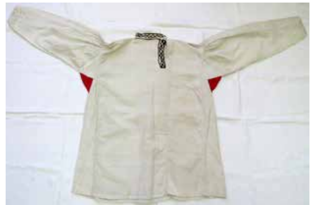
Фото 17. Рубаха мужская свадебная, с красными ластовицами, 1887 г. изготовления, с. Богатое Богатовского р-на Самарской области.

Сарафаны уходят в прошлое. Самой распространенной женской одеждой становятся юбка и кофта. Costume частично теряет свой возрастной ценз. Информанты сообщают, что была сшита праздничная парочка и носилась она по праздникам много лет, пока появится возможность сделать обновку, за это время успевали выйти замуж, родить детей. Функциональность costume сохраняется, в кофтах с изнаночной стороны в боковые швы вшиваются ремешки из ткани, для регулирования размера одежды. Они позволяли носить женщине costume и в период беременности. Иногда эти ремешки делали широкими, застегивались под грудью, частично выполняя роль белья. Исчезают такие детали costume как лакомка и тканый пояс. В женской одежде тканый пояс заменяют лямки фартука, но к середине XX в. фартук становится исключительно бытовой вещью и исчезает из выходного costume. Пояс до сегодняшнего дня присутствует в costume как необязательная его часть, но он сохранил свои функции