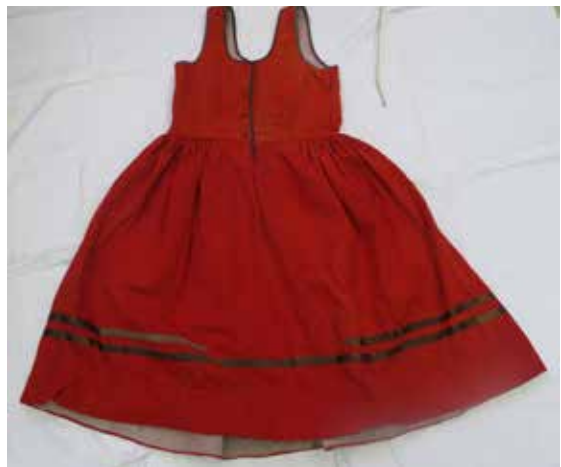
Фото 5. Сарафан с лифом, с. Кураповка Богатовского района Самарской области.