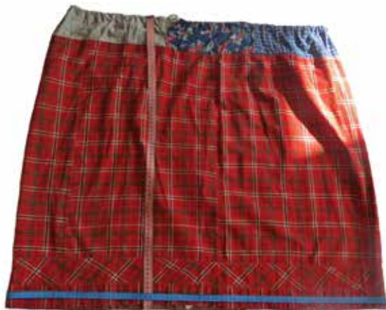
Фото 3. Юбка-подставОк, прямого кроя, с. Аверьяновка Богатовского района Самарской области.

красных и белых квадратов, внутри красных квадратов размещены по пять белых крестов. Подол рубахи подрублен швом мережка.