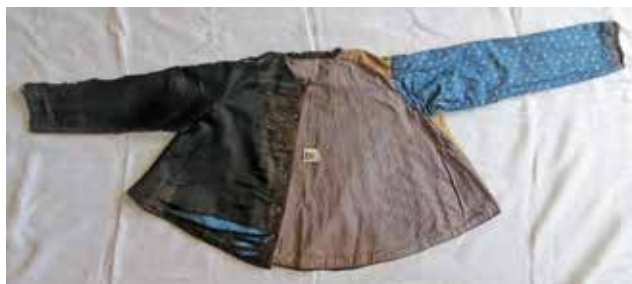
Фото 12. Кофта «камлотовая», с. Аверьяновка Богатовского района Самарской области.

Прямой рукав собран по плечу в складки, внизу выполнены защипы. В комплект входит фартук из штапеля оранжевого цвета, представляющий собой прямое полотно, верхний край которого отогнут внутрь и пришит, в образованный пояс вставляются длинные лямки. По низу фартука нашиты узкие атласные ленты синего цвета и белое кружево. На архивной фотографии Кураповского хора участницы – в однотонных парочках ярких цветов: голубых, зеленых, желтых, розовых, красных оттенков, и в фартуках контрастного цвета. Голова покрыта светлым платком, который завязывается под подбородком. В анализируемом нами комплексе сохранилось цветовое решение, традиционная отделка и конструкция костюма, изменились способ пошива и качество ткани, утеряны некоторые элементы костюма (фото 10). Усманский наряд ярко иллюстрирует, как может меняться традиционная одежда со временем. По его описаниям 1973 г. «в комплект входили: юбка и кофта, сшитые из одного материала, рубаша, нижняя юбка, волосник, платок, янтарик, груса и ожерелок, гусарики» (Антонова, 2002. С.15).