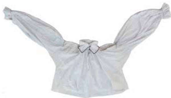
Фото 15. Кофта женская короткая, с прямыми поликами, из коллекции Е.В. Ямщиковой, с. Тростянка Богатовского района Самарской области.