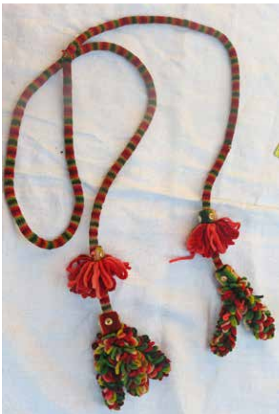
Фото 7. Пояс круглый, с. Тростянка Богатовского района Самарской области.

К концу XIX в. происходит развитие по пути упрощения - повсеместно косоклинный сарафан уходит в прошлое, заменяется на «прямой» («круглый», «московский») сарафан, сшитый из 5-9 прямых полотнищ ткани в «трубу», как широкая (3-6 м) длинная юбка, вверху собранная в мелкие складки или «боры». Держался сарафан на плечах с помощью двух пришитых лямок, которые соединялись в одной точке по середине спинки, а на груди разводились и фиксировались на расстоянии 20-30 см друг от друга. Лямки могут быть и с «лягушкой» - прямая полоса ткани режется вдоль по середине, не доходя до конца 6-10 см, оставляется целой, все срезы обшиваются тканью или тесьмой. Спереди или сбоку делался разрез, застегивающийся на пуговицу или крючок.