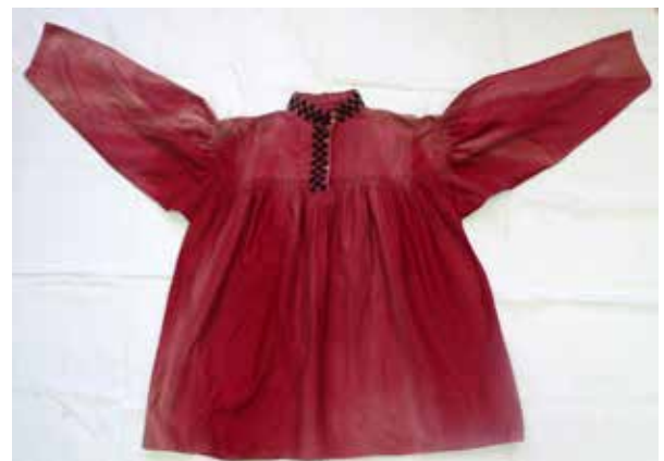
Фото 18. Рубаха мужская, на кокетке, 1907 г., с. Кураповка Богатовского района Самарской области.