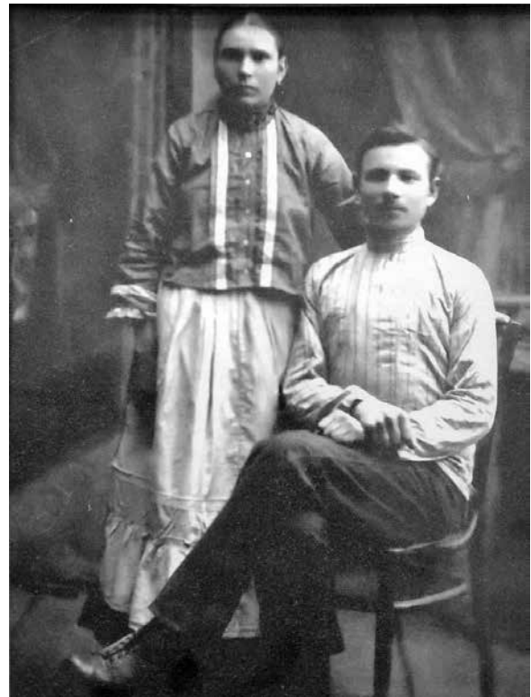
Фото 13. Семейная фотография молодой четы (с. Печинено Богатовского р-на Самарской области).