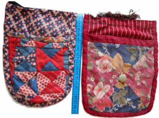
Фото 9. Карман-лакомка, с. Богатое Богатовского района Самарской области.