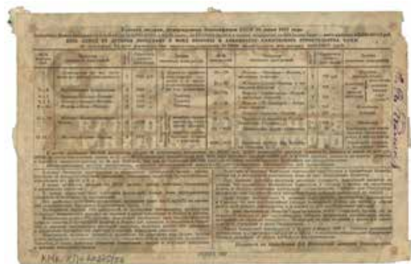
Лотерейный билет Второй всесоюзной лотереи ОСОАВИАХИМА. 1927 г. КР-20275/56

розыгрышах граждане в качестве главного приза могли получить билет на кругосветное путешествие по маршруту Москва – Берлин – Париж – Нью-Йорк – Чикаго – Токио – Владивосток – Москва. Вторым по значимости призом был полет на дирижабле над Москвой, Ленинградом или Харьковом. В 1937 г. было напечатано 80 000 000 билетов. Примечательны призы того времени – охотничьи ружья, малокалиберные винтовки, противогазы, военизированные детские игрушки (КП – 20275/56, КП – 20275/57).