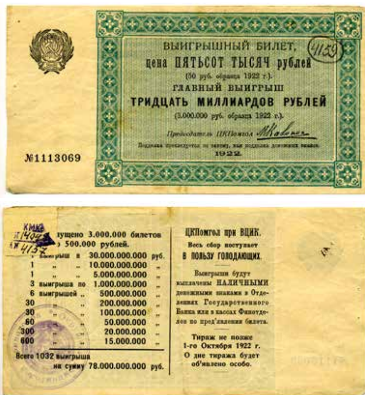
Лотерейный билет в пользу голодающих. 1922 г. КП-4159.

В 1927 г. такая же лотерея называлась «2-я Всесоюзная лотерея Осоавиахима», в 1928 г. была 3-я лотерея. Так все последующие годы вплоть до 1941 года, когда была проведена 15-я лотерея. Исключение составляет 1938 год. Многие склоны считать родоначальниками современных российских лотерей именно тиражи лотереи Осоавиахима, будущего ДОСААФ. Уже подчеркивалось, что в этих