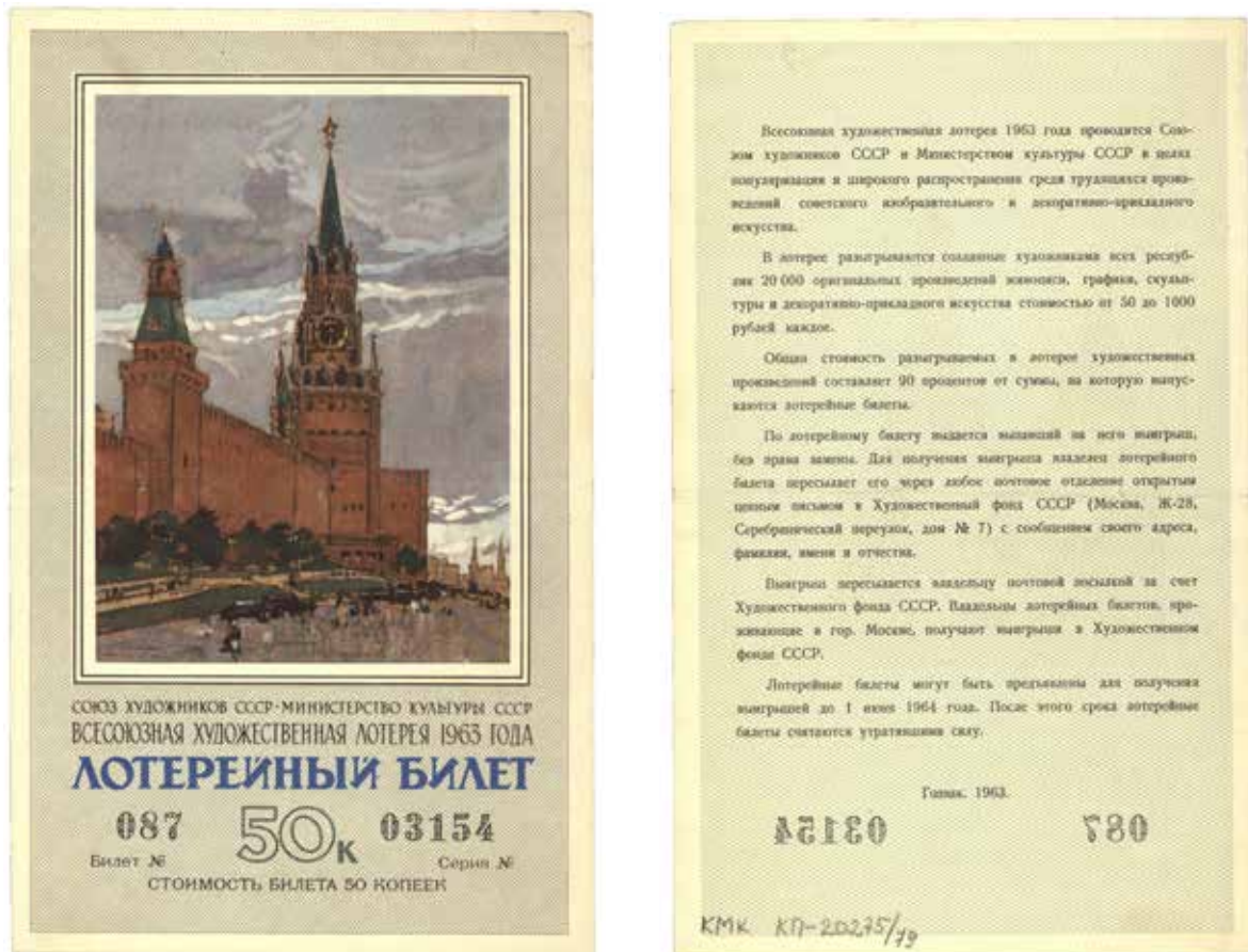
Лотерейный билет Всесоюзной художественной лотереи. 1963 г. КР-20275-79

художественные лотереи были исключительно «вещевыми», никакая замена выигрышей деньгами не допускалась. В 1966 г. среди призов были еще и комплекты мебели. Всего было проведено 14 лотерей: в 1963, 1966, 1968, 1971 гг. и далее один раз в два года. Номинал билетов всех этих лотерей был 50 копеек (КП – 20275/79).