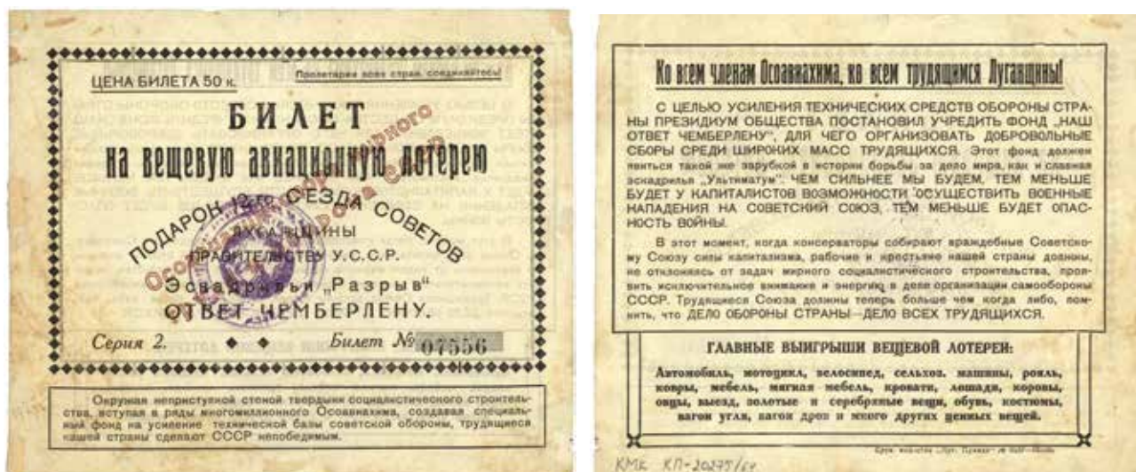
Билет вещевой авиационной лотереи «Ответ Чемберлену». КР-20275/64

билет первой вещевой Всеукраинской лотереи 1925 года (КП – 20275/51), билеты санаторно-курортной лотереи Украины (КП – 20275/52, КП – 20275/53, КП – 20275/54), билеты второй студенческой лотереи Украины 1927 года (КП – 20275/58, КП – 20275/59). Об этих последних несколько подробнее. Среди выигрышей для студентов были тракторы, молотилки, сноповязалки, веялки, дома с усадьбами, мебель, одежда и головные уборы, часы и музыкальные инструменты, радиоаппаратура, скот, даже дойные коровы! Это не все. Внизу на билете мелким шрифтом было написано: «Кроме того, будут разыграны высокохудожественные вещи исторического значения, закупленные у Ленинградского Госфонда: вазы, хрусталь, фарфор, картины, бронзовые статуэтки и мебель» (КП – 20275/60).