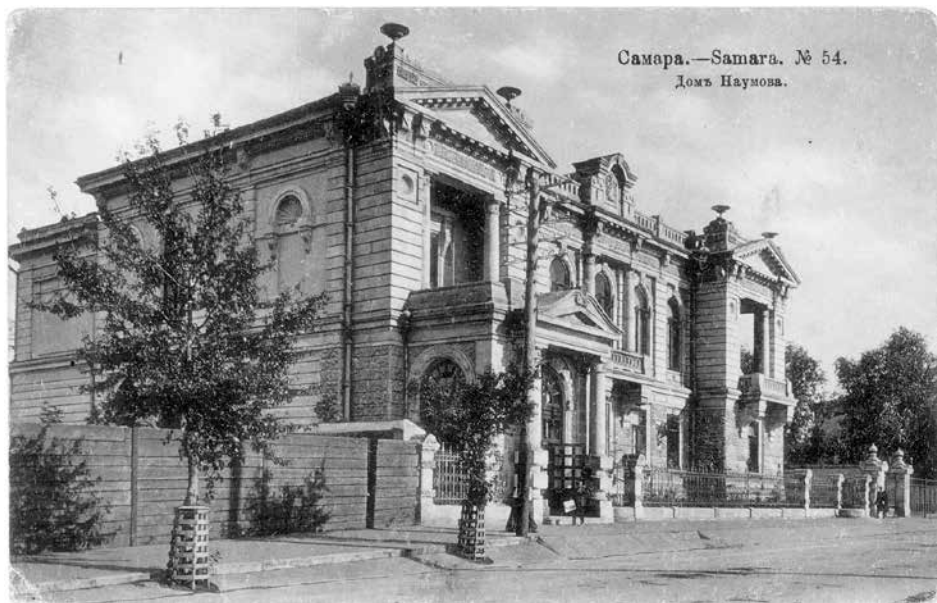
Особняк А.Н. Наумова. Архитектор А.А. Щербачёв. 1907 г.