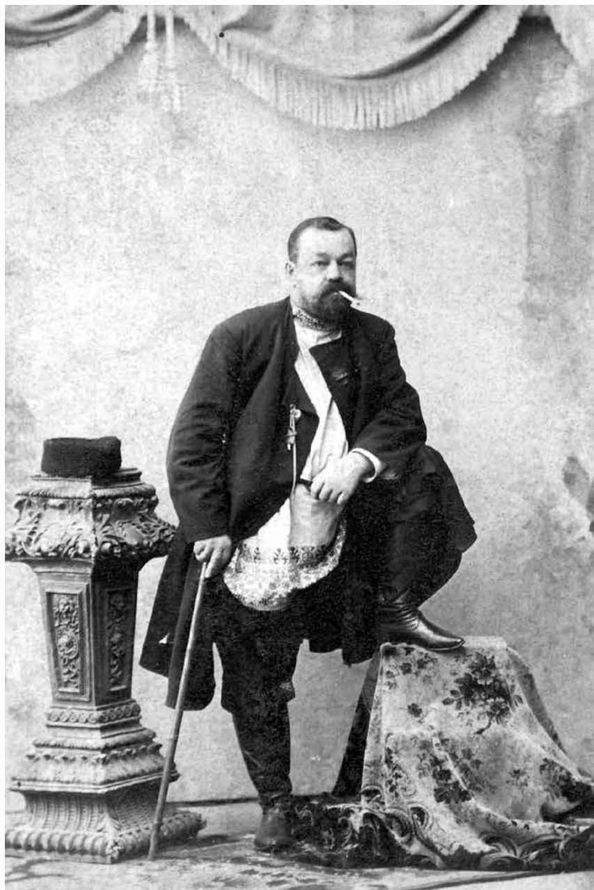
А.А. Щербачёв. Самара. 1900-е гг.