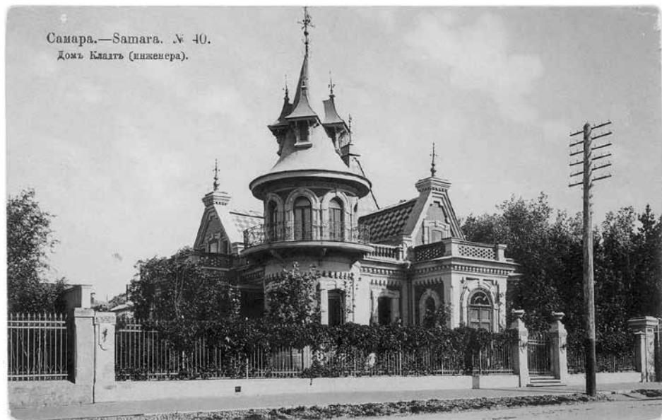
Особняк И.А. Клодта. Архитектор А.А. Щербачёв. 1898 г.