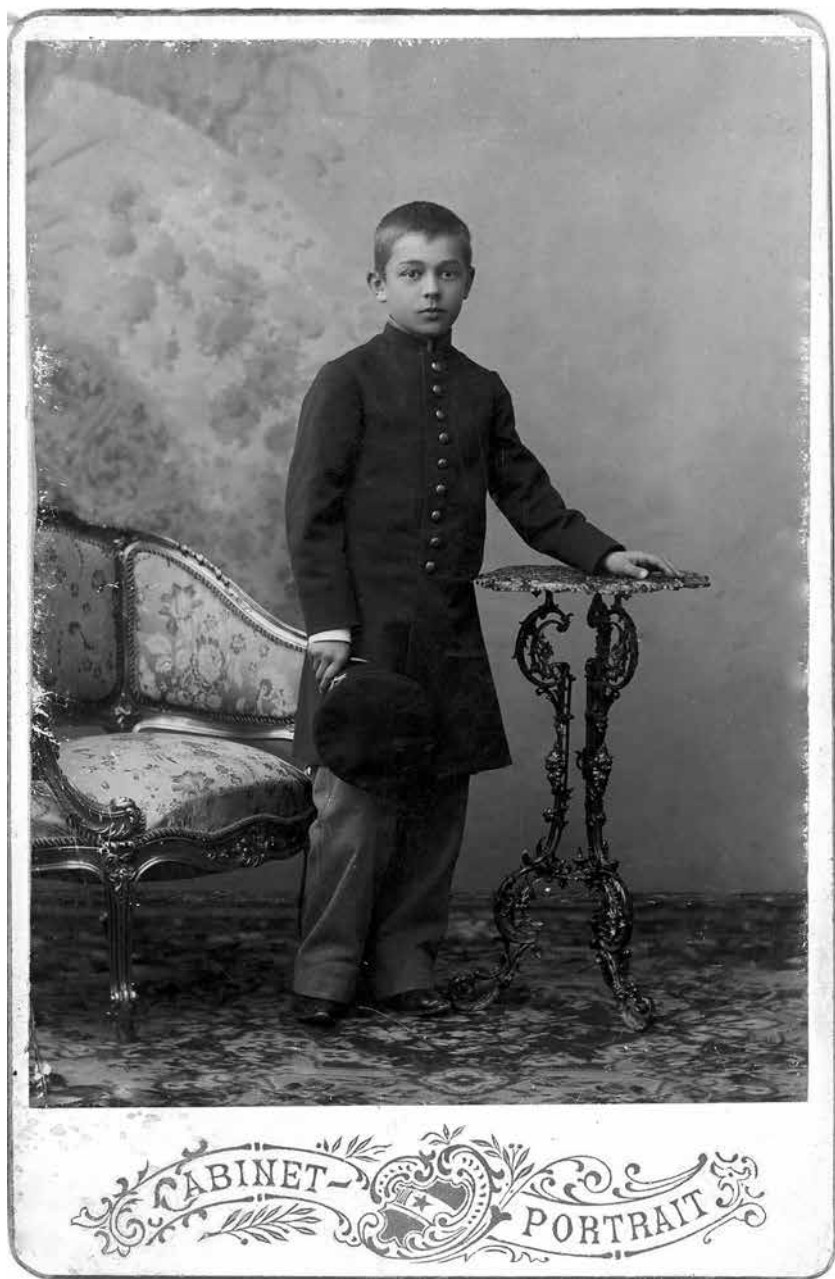
П.А. Щербачёв. Самара. 1902 г.