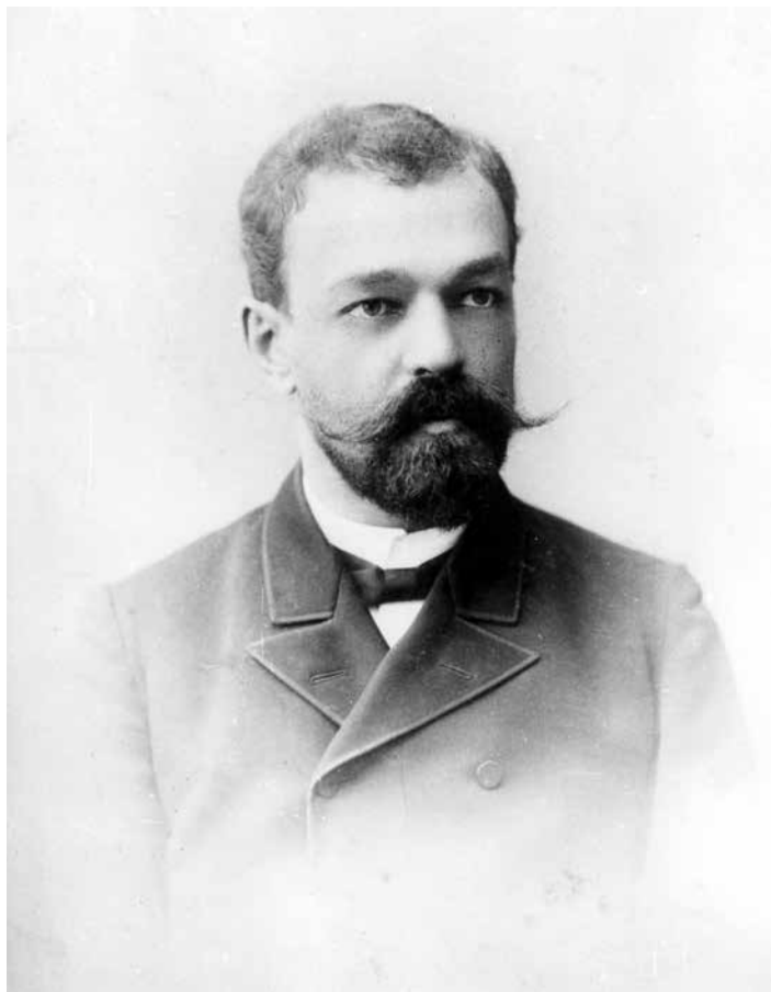
А.А. Щербачёв. Самара. 1889 г.

Строительство нашего города почти на протяжении четверти века, с 1880 г. по 1912 г., связано с именем талантливого архитектора Александра Александровича Щербачёва. Он относится к числу зодчих, создавших архитектурный облик дореволюционной Самары.