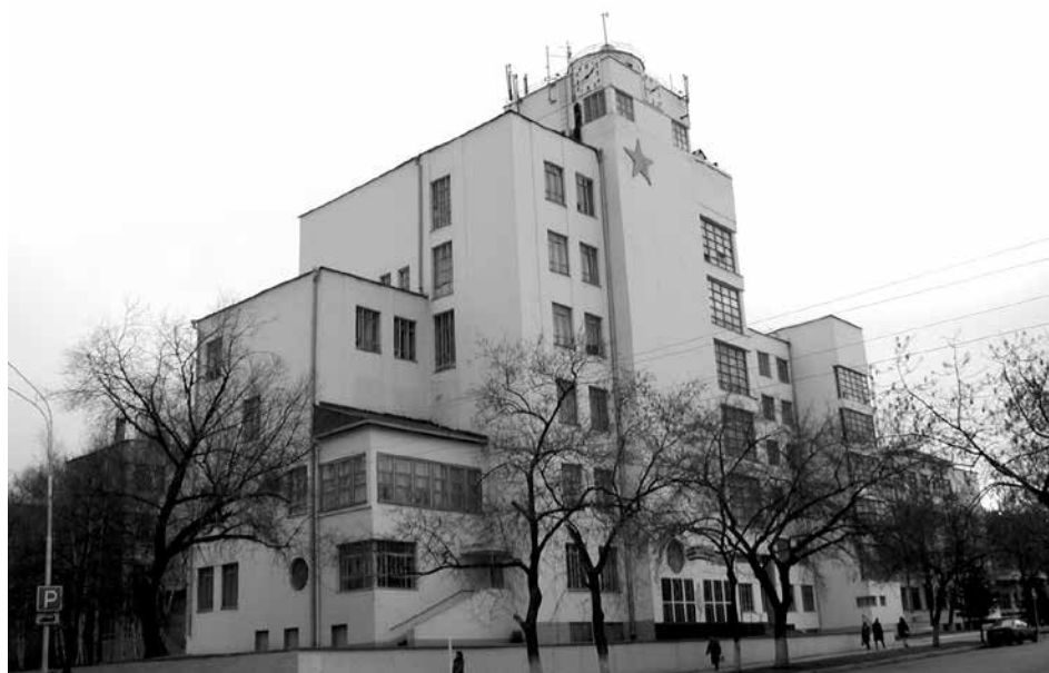
Штаб ПривО. Архитектор П.А. Щербачёв. 1930-е гг.